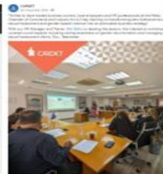
REPORTAGE: DESA DE SPAIN, "TEAMWORK 2" A LA ALTA